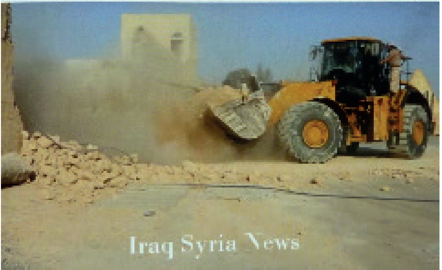
Mar Elians kyrka med rötter från 200-talet. Den undre bilden är klippt ur en reklamvideo från IS.

i landet som ockuperats av IS, finner man ett intressant sammanträffande!